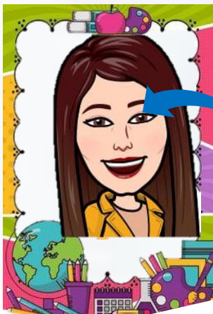
Historia y Geografía