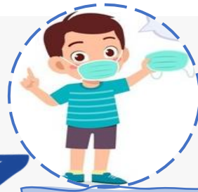
MASCARILLAS DE REPUESTO

¡NO OLVIDES LA REGLA DE LAS 3M's! Y TU KIT PARA CLASES PRESENCIALES