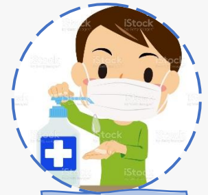
ALCOHOL GEL DE BOLSILLO